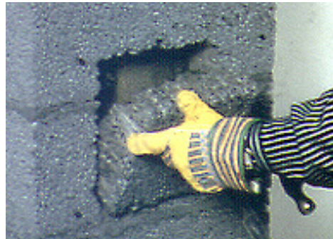
Bilde 2. Leca-biten tas ut.