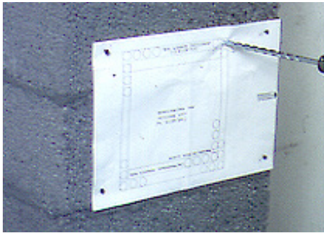
Bilde 1. Bor med et betongbor i henhold til sjablonens merking gjennom ytterelementet. Bruk ikke slagdrill!

Montering: Fest først sjablonen der feieluka skal plasseres.