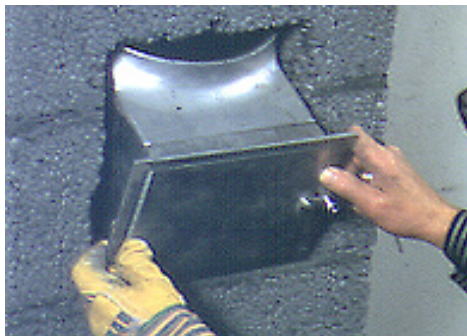
Bilde 3. Plukk ut mineralullen og plasser feieluka med ildfast masse påført feielukestussens flens. Press feieluka ned mot bunnen av åpningen.