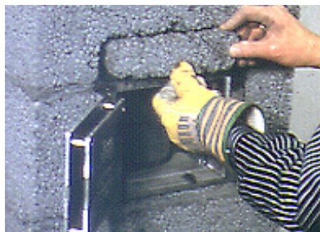
Bilde 5. En Leca-bit tilpasses for innmuring over luke, og det hele pusses pent inn.