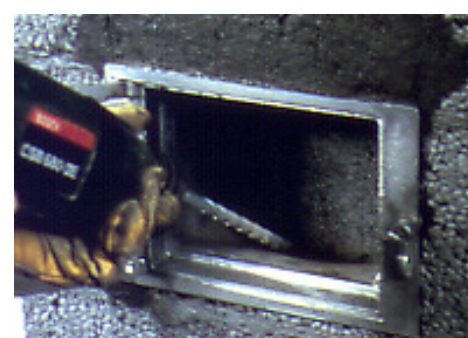
Bilde 6. Deretter bores gjennom luka hull i foringen tilpasset stussen på feieluka. Denne boring utføres som vist på baksiden av sjablonen. Kantene avrundes pent, tett skikkelig med ildfast masse i overgang mellom foring og stuss på feieluka.